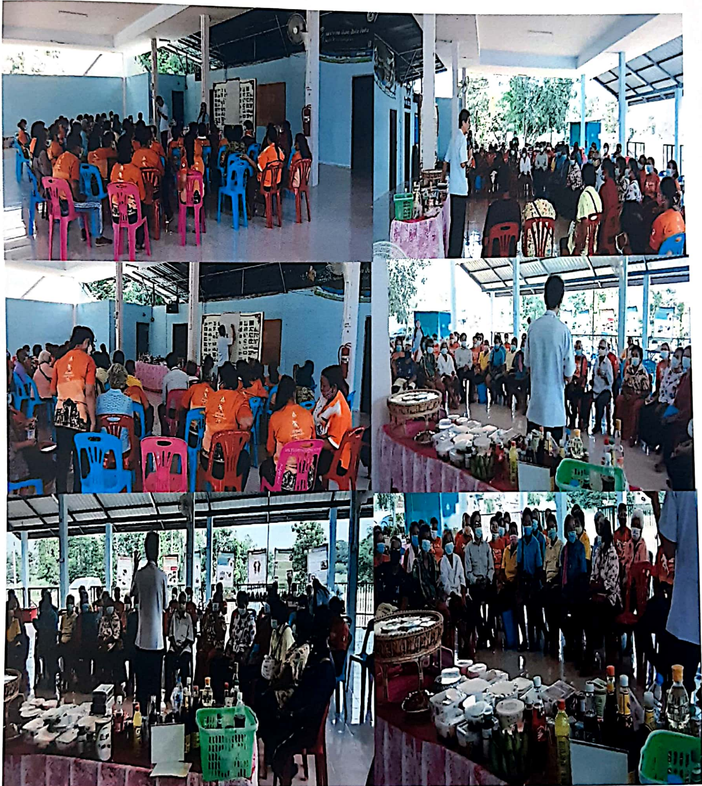
ภาพดำเนินโครงการอบรม อสม.ผู้ดูแลผู้ป่วยโรคเรื้อรังและอบรมผู้ป่วยโรคเรื้อรัง