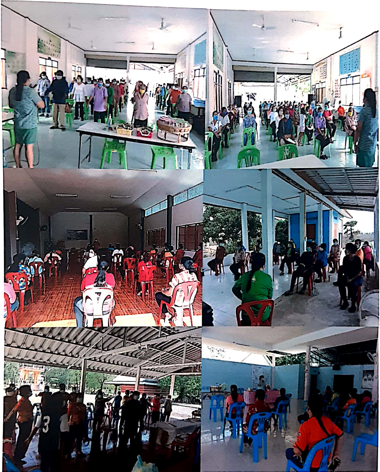
ภาพประกอบการดำเนินโครงการอบรมบรมกลุ่มเสี่ยงโรคไม่ติดต่อในกลุ่มอายุ 35 ปี ขึ้นไป